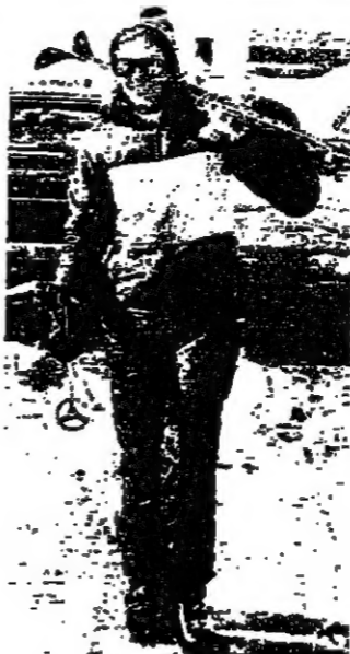
والترج لم يفت اوانه

وزير الأشغال يستقبل وفدا من نقابة المحررين استقبل وزير الأشغال العمالية الدكتور جورج سعادة أمس، نقابة المحررين السيد مكرم ووفدا من مجلس النقابة. وقد عرض نقابة المحررين على الوزير سعادة بطرحين للمحررين يرتبط قرارهما بوزارة الأشغال هما: تسهيل اسفار المحررين، والغاء السبلات لغيرهم الى الدول العربية والصديقة فأبدى الوزير اهتماما بالطلبتين ووعده بدرسهما واتقارهما قريبا.